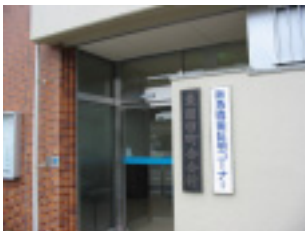
南側の入り口には証明コーナーの看板が掲げられました。