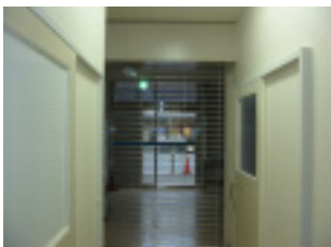
新しい事務所の入り口です。(左は新しくなったトイレ)