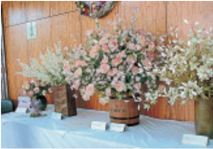
アートフラワーの大作

一階では、俳画、パッチワーク、アートフラワー、生け花などの展示。二階の大ホールでは、ダンスパーティーや民謡、新舞踊などの舞台発表。日頃、地区会館で活動されている各グループの発表会が、広い会館を使って盛りだくさんに行われました。アートフラワーの大作には、葉や花弁一つ一つに作者のひたむきな思いが込められ、圧倒されます。油絵や俳画、生け花、ダンスや詩吟、豊かな趣味は日々の暮らしを潤すといえます。「何かやり始めようかな」と、思わせるような一日でした。