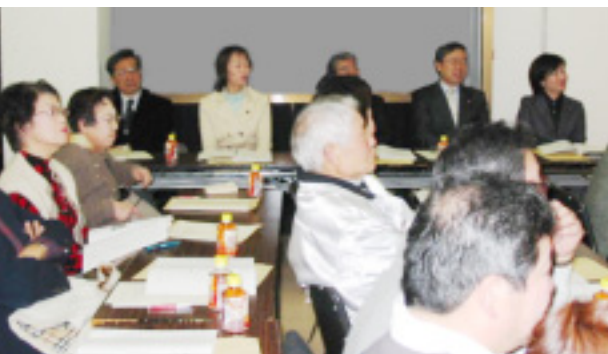
体験話に聞き入る(会場)

戦後体験文集「戦後60年：語る、そして私は願う」は、町会事務所で、一冊500円でお渡ししています。