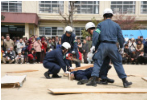
チェーンソーを使つての救助活動