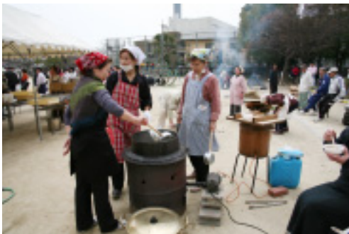
避難食「豚汁」の炊き出し