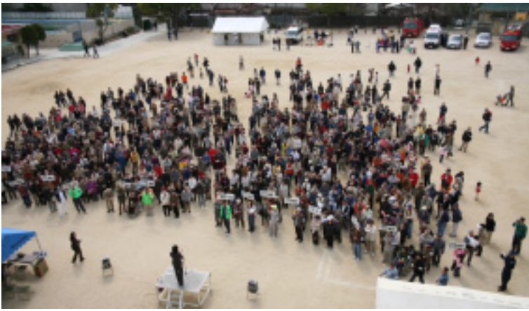
参加者を前に市長あいさつ