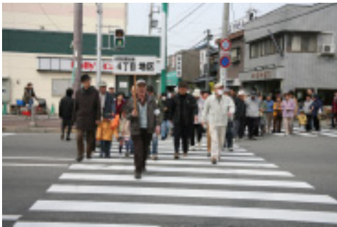
避難経路を通り会場へ

自然災害にとどまらず、あらゆる面で、安全で住みやすい町づくりを皆さんと一緒に進めていきたいと考えています。今後とも一層のご協力をお願いします。