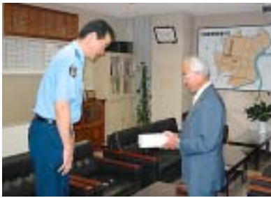
東警察署長に寄贈

7月21日に、東園田町会が防犯パトロール用に作成した「防犯啓発テープ」11本を、尼崎東警察署に寄贈しました。