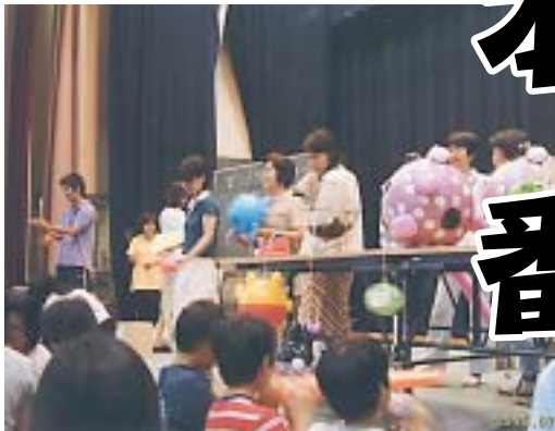
7月20日 ふるさと祭り