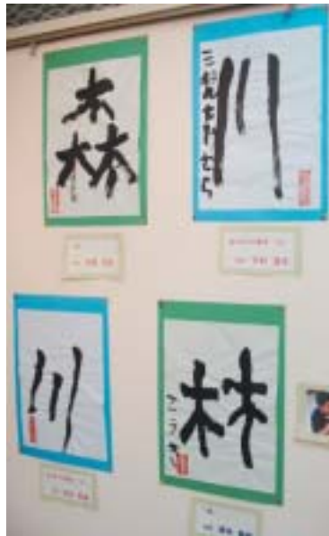
力強く書かれた文字