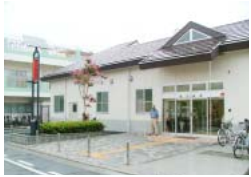
太陽光と風力による発電が備えられています