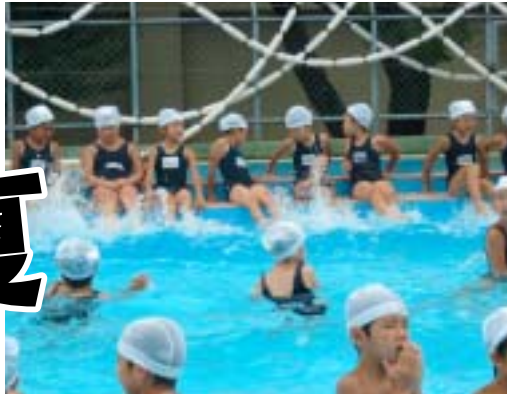
7月31日 園和小学校プール