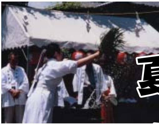
7月28日 白井神社の湯がぐら