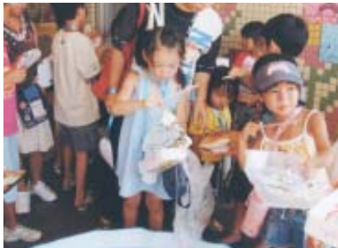
7月28日 みらいっこひろば サマーカーニバル

梅雨があけたら、すぐに夏がやってきました。暑い夏の日差しの中、元気に遊ぶ子ども達。まぶしさと、なつかしさと、いとおしさとを感じます。暑いこの夏、地域のまじわりをとおして、あなたのまわりの子ども達に目を向けて見ませんか？