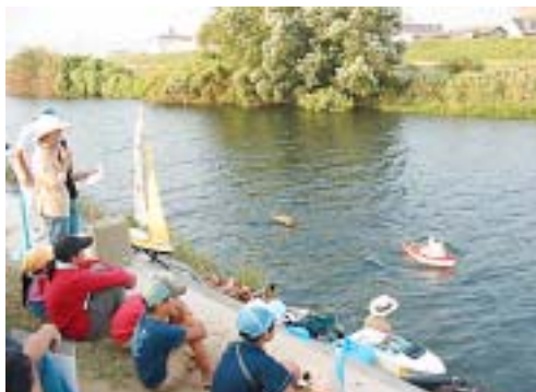
8月5日 六丁目けやき通り親子まつり