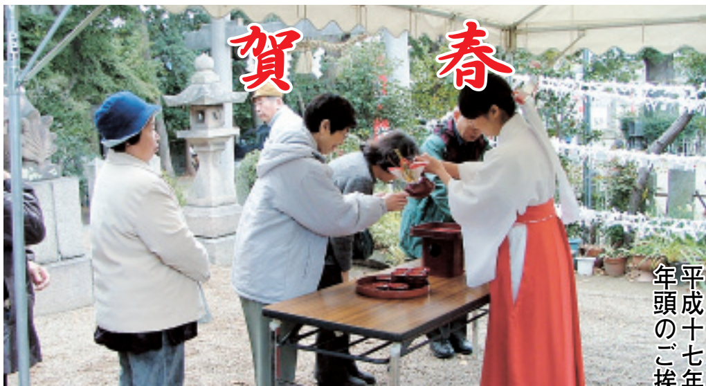
平成十七年 年頭のご挨拶