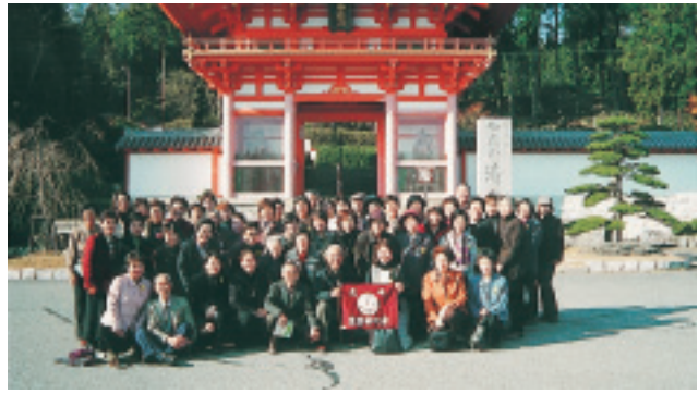
播州清水寺仁王門の前で

秋は山から下りてきます。高い山々では八月末頃からひんやりとした秋風が吹き始め、九月半ばからは草や木々の葉も色づき始まります。山によって紅葉・黄葉の様子はそれぞれ異なり、まるで山というキャンパスに描かれた、自然の絵画のように見えます。