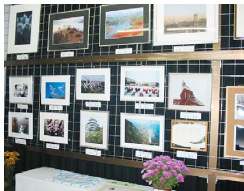
高い技術の写真作品