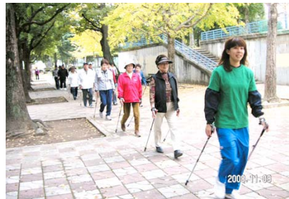
ポールを使ってウォーキング

グンゼスポーツから、公認の女性インストラクター2名に指導に来ていただき、猪名川公園で開催しました。