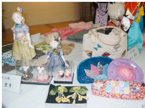
心のこもった手芸作品