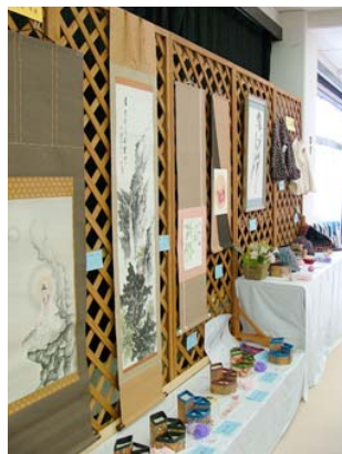
手作りの表装作品

公民館で活動している皆さんが日頃の成果を展示・舞台で発表されました。2日間で287名の来館があり、楽しい発表会となりました。