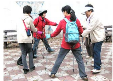
歩く前にゲームも

運動前にポールを使ってストレッチを行い、二人一組でゲームをした後、正しいポールの使い方を教わり、数十分「ワイワイ、ガヤガヤ」と話し