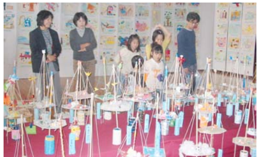
メリーゴーランド