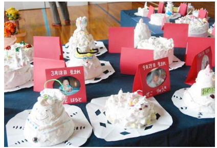
「おたんじょう日おめでとう」

秋日和のひととき、園和北小学校を訪問しました。広い体育館いっぱい元気な子どもたちの作品と出会いました。一点一点力作ぞろい、今年「平面と立体」がテーマ。一年生の立体作品「おたんじょう日おめでとう」のリースデイクーキには、大変夢があり、作った子どもたちの赤ちゃん