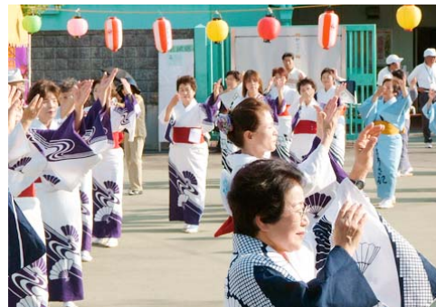
各婦人会の盆踊り