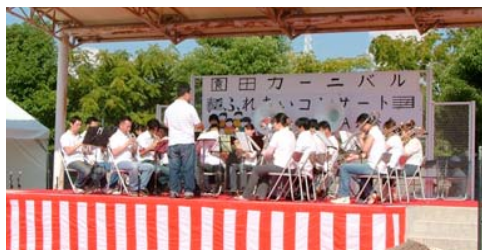
ステージでは吹奏楽の演奏も

大きなマリオがふくらんでいます。ダンスや演奏が続いて、炎天下にも拘わらず、たくさんの方々が客席より温かい拍手を送っていらつしやいました。そして最後は15地区そろっての