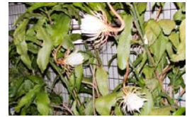
22時 月下美人が 見事に!! 人が

*地区パトロール 8月29日(土)19時30分～ ・パトロール後、夏祭りの反省会と慰労会 Ⓣ地区役員会 9月19日(土)19時30分～