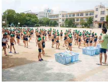
プールの季節、暑い夏も子どもたちは元気いっぱい!