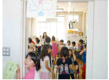
学校公開日に園和こども祭り、体育館と教室を使ってお店づくりが行われました。