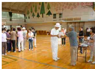
優勝者チームには賞品を

いくことが勝利につながるのよ」と教えてくれました。ゲーム終了後、表彰式で一位から三位までが発表され、参加者全員に参加賞が渡されました。