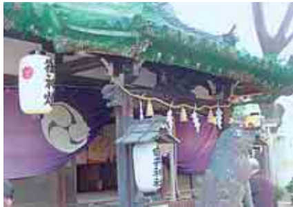
今年秋には新しいお社に建て替えられます

終了後、全員がお神酒を頂き、椎堂の十九神社へ向いました。徒歩15分で到着し、参拝。次いで猪名川自然林の