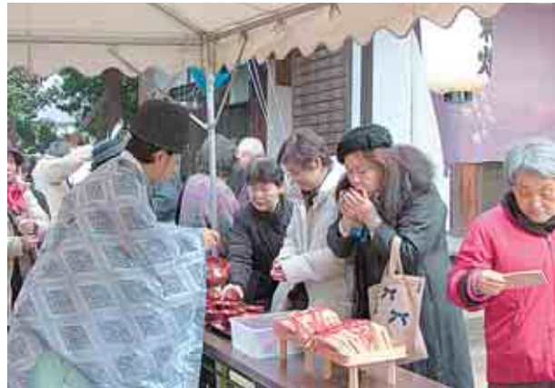
お神酒を頂きました

ならではの人と人とのつながりと幸せを感じる一幕でした。来年も、皆様の参加をお待ちしています。楽しい一日を有り難うございました。