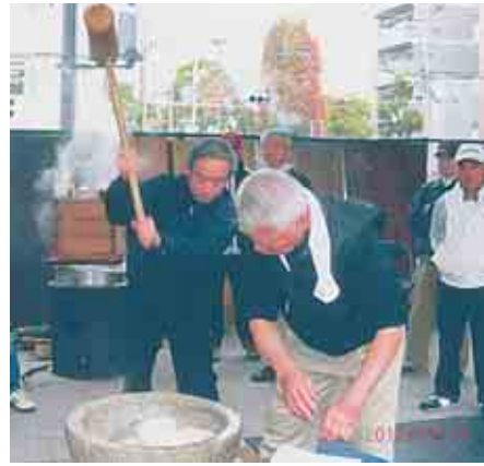
三丁目西・四丁目・五丁目