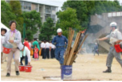
バケツ水による一般火災消火訓練