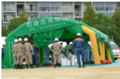
応急救護所設営(圧縮空気による)