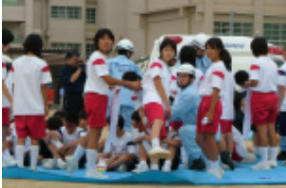
負傷者(軽症)の誘導及び応急手当