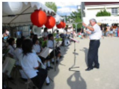
オープニングは吹奏楽で・・・