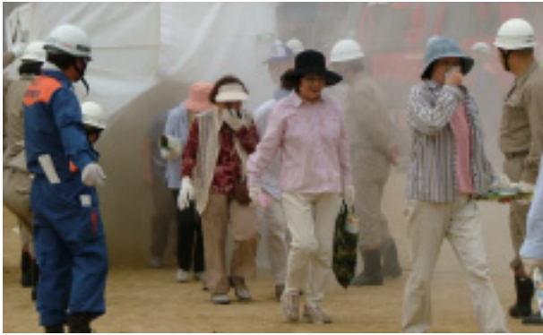
避難誘導訓練 - 煙の中を歩く体験

このような訓練想 定のもとに、小園中学 校で尼崎市災害対策 本部を中心とする関 係機関の協力のもと、 市民参加の地震災害 対策総合訓練が行わ れました。 JRの事故の際に も効果を発揮した、ト