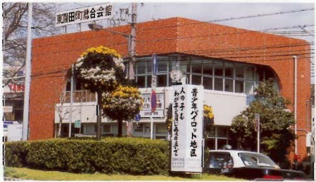
東園田町総合会館 (町会会館・事務局) 所在地/東園田町4丁目94-2

町会会館 2階大ホール・和室は、各種会議や講習会・展示会などに使用出来ます。 また、コミュニティホールは、各種会合や葬祭などにも利用出来ます。 ご使用を希望される場合は、事務局にご連絡ください。(会員割引があります)