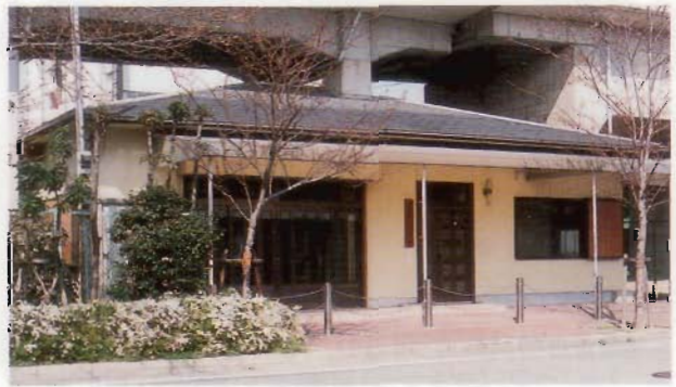
園和コミュニティホール 所在地/東園田9丁目48-16